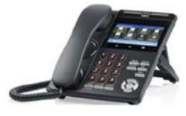
DT930 TOUCH NEC