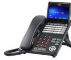
DT930 24CG NEC