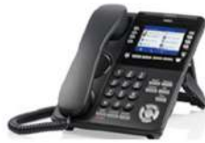
DT920 COLOR NEC